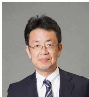
国土交通省 住宅局 安心居住推進課 課長 ： 上森 康幹氏