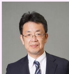
国土交通省 住宅局 安心居住推進課 課長 ： 上森 康幹氏